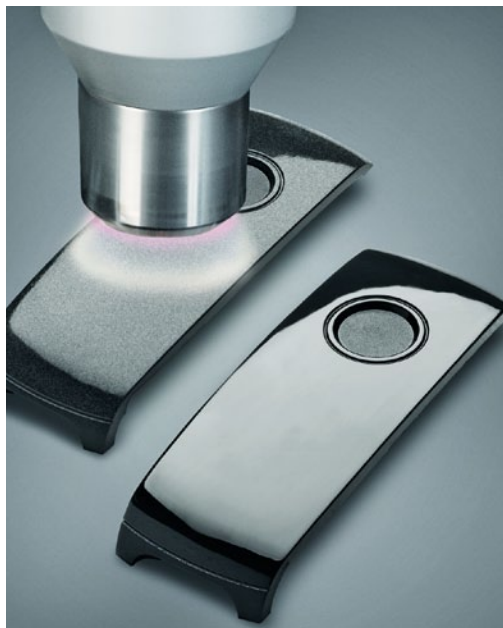
Zur Sicherung des homogenen Lackverlaufs und der langzeitstabilen Haftung des Lackes werden die Polyamid-Schalen des Designschlüssels mit atmosphärischem Plasma vorbehandelt

Wenn sich zusatzfreie Kunststoffe trotz sauberer Oberfläche schlecht beziehungsweise gar nicht beschichten oder kleben lassen, so liegt das mit Sicherheit an ihrer geringen Polarität und der folglich niedrigen Oberflächenenergie ( \text{mJ}/\text{m}^2 ). Letztere bezeichnet die Energie, die bei der Erzeugung neuer Materialoberflächen zum Aufbrechen der chemischen Bindungen notwendig ist.