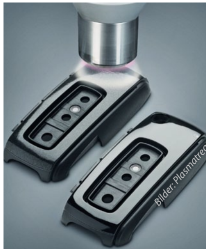
Links: Vorbehandlung der PA-Schlüsselunterschale mit Openair-Plasma. Rechts: dasselbe Teil nach Auftrag der transparenten Kratzfestbeschichtung.

Um die Schlüsselschalen dennoch wie gefordert lackieren zu können, entschloss man sich, die Kunststofffertigung zu ändern: Anstatt des normalen Spritzgießverfahrens und der üblichen Narbung der Schlüsseloberfläche zum Kaschieren von Unebenheiten, wurden die Schalen in einem MuCell-Spritzguss, einem physikalischen Schäumprozess für Thermoplaste, gefertigt. Mit diesem Prozess kann nicht nur eine perfekte Abbildung der Werkzeugoberfläche erzeugt, sondern es können auch die sonst üblichen Einfallstellen und Unebenheiten vermieden werden. Allerdings gab es auch hier ein Problem: Der Schäumprozess hinterließ auf dem Werkstück sichtbare Schlieren, auch war die Oberfläche