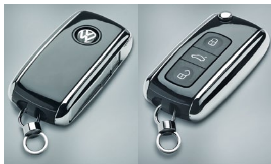
Perfekte Lackierung: Vorder- und Rückseite des fertigen Designschlüssels präsentieren sich in tiefschwarzer, hochglänzender Optik

nach dem Spritzgießen nicht mehr tiefschwarz, sondern eher anthrazit.