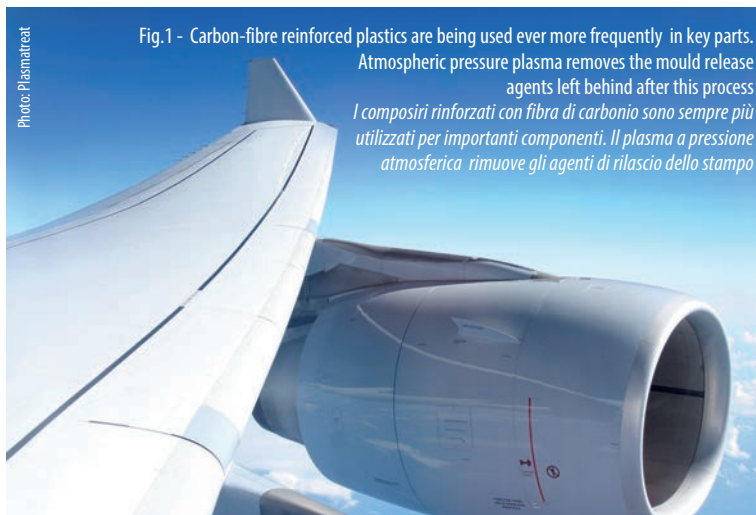
Fig.1 - Carbon-fibre reinforced plastics are being used ever more frequently in key parts. Atmospheric pressure plasma removes the mould release agents left behind after this process I composiri rinforzati con fibra di carbonio sono sempre più utilizzati per importanti componenti. Il plasma a pressione atmosferica rimuove gli agenti di rilascio dello stampo

Inès A. Melamies, specialized journalist