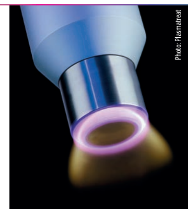
Fig. 2 - Openair-Plasma allows for microfine cleaning, strong activation and functional nanocoating of material surfaces.

Una caratteristica speciale del processo al plasma è che il fascio al plasma è a carica neutra, estendendo e semplificando la serie delle applicazioni possibili. L'intensità è così alta